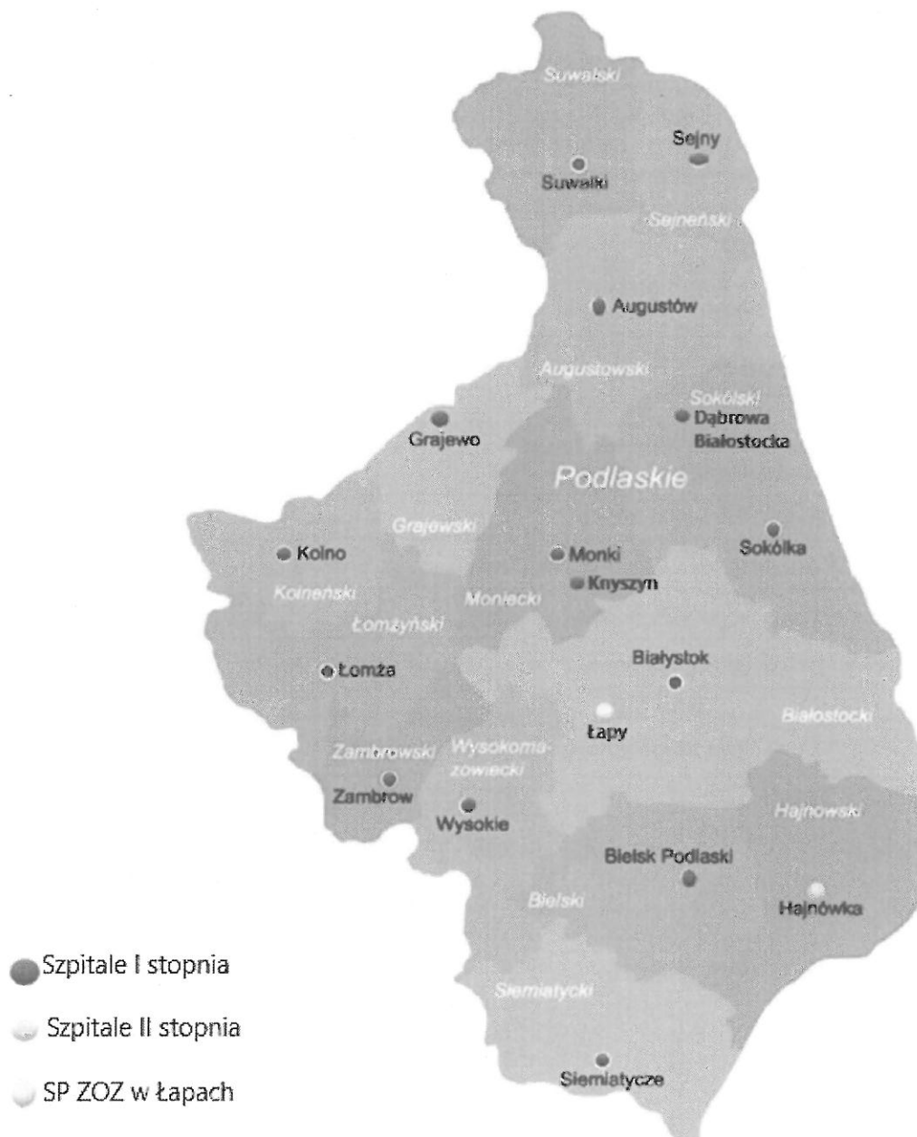
Rysunek 1. Wykaz powiatowych szpitali I i II stopnia PSZ w województwie podlaskim.